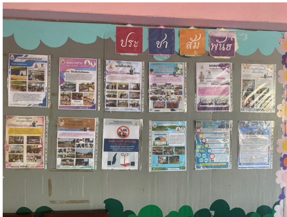
ป้ายประชาสัมพันธ์นโยบายการไม่รับของขวัญและของกำนัลทุกชนิดจากการปฏิบัติหน้าที่ (No Gift Policy)